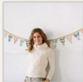
Daisy Baby Bottega