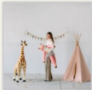
Daisy Baby Bottega