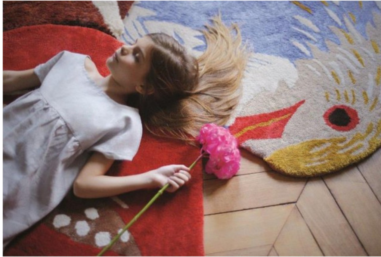
Tappeti a forma di animali in fibra di eucalipto Little Calibri

Sono passati gli anni in cui la camera del bambino era l'ultimo ambiente della casa ad essere arredato; con l'idea che tanto poi il bimbo cresce non si prendevano minimamente in considerazione oggetti di design per creare un ambiente raffinato ed elegante anche per l'ultimo arrivato. Oggi le mamme sono molto attente alla moda , sia per loro che per i propri bambini e lo dimostra il successo che ogni anno riscuote Pitti Bimbo , la vetrina della moda dedicata ai più piccoli che si svolgerà a Firenze dal 26 al 28 giugno . Che si tratti di abbigliamento o home decor poco importa, le mamme sono attente, informate e seguono il mutare degli stili senza farsi sfuggire nessun particolare.