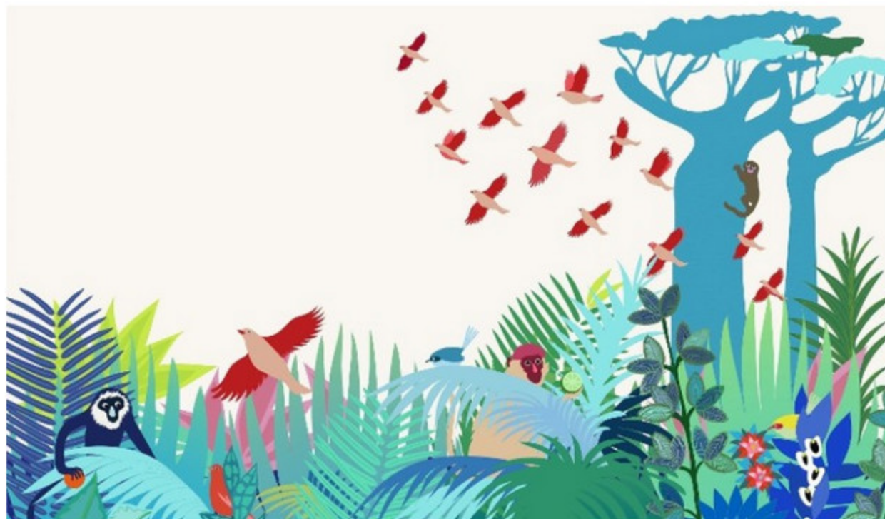
Carta da parati Little Calibri