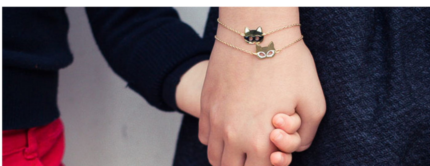
Bracciale con animali

Proprio l'anno scorso, per mio compleanno, mia madre mi ha regalato un bracciale che portavo da piccola. Non avrebbe potuto farmi un regalo più speciale: avevo tanti bei ricordi legati a quel piccolo oggetto! Adesso sto cercando qualcosina di originale per il battesimo di mia figlia, questi gioiellini sembrano perfetti!