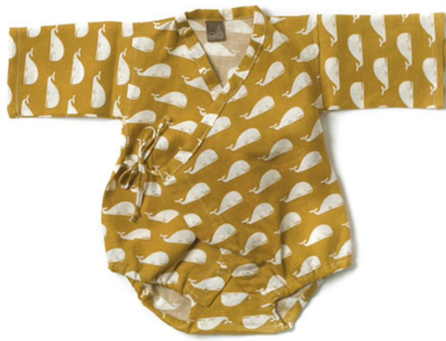
Kimono chic by Zebi Baby

Non parliamo poi di gioielli in versione petit per mamme! A Parigi ho trovato dei bracciali con disegni divertenti, piume, gufi e croci, che mi hanno riportata indietro alla mia infanzia... con un po' di nostalgia.