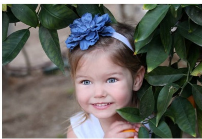
Fermagli per capelli by PLH Bows

Mi ricordano i cappelli di Ascot, con questo tocco di fantasia delicato... immaginate che amore per Pasqua! Con questo delizioso accessorio si riesce a rendere originale qualsiasi look, dal completo jeans e maglietta ai vestitini più formali. Lo stesso brand ha anche delle piccole clip da capelli per noi mamme, per divertirvi ad "abbinarci" alle nostre piccole. Troppo carini!