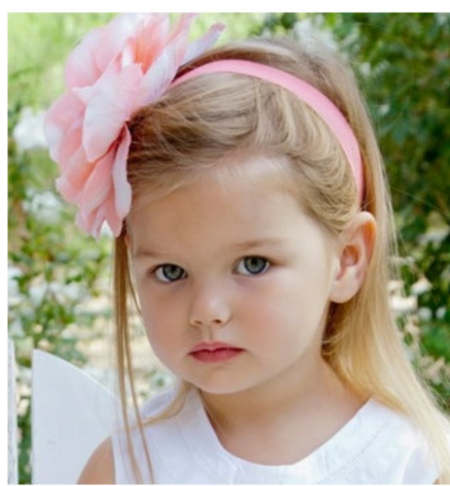
Fermagli per capelli by PLH Bows